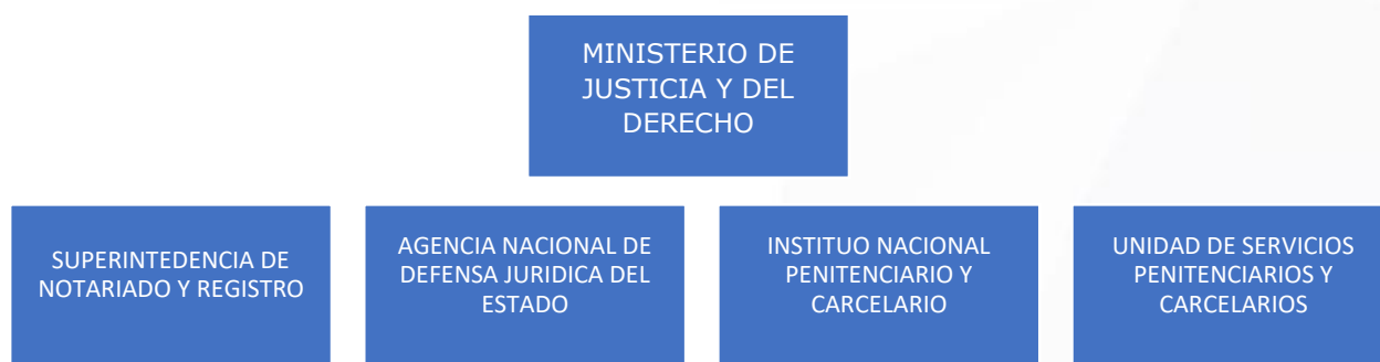
Ilustración 8. Entidades del sector Justicia y del Derecho encuestadas