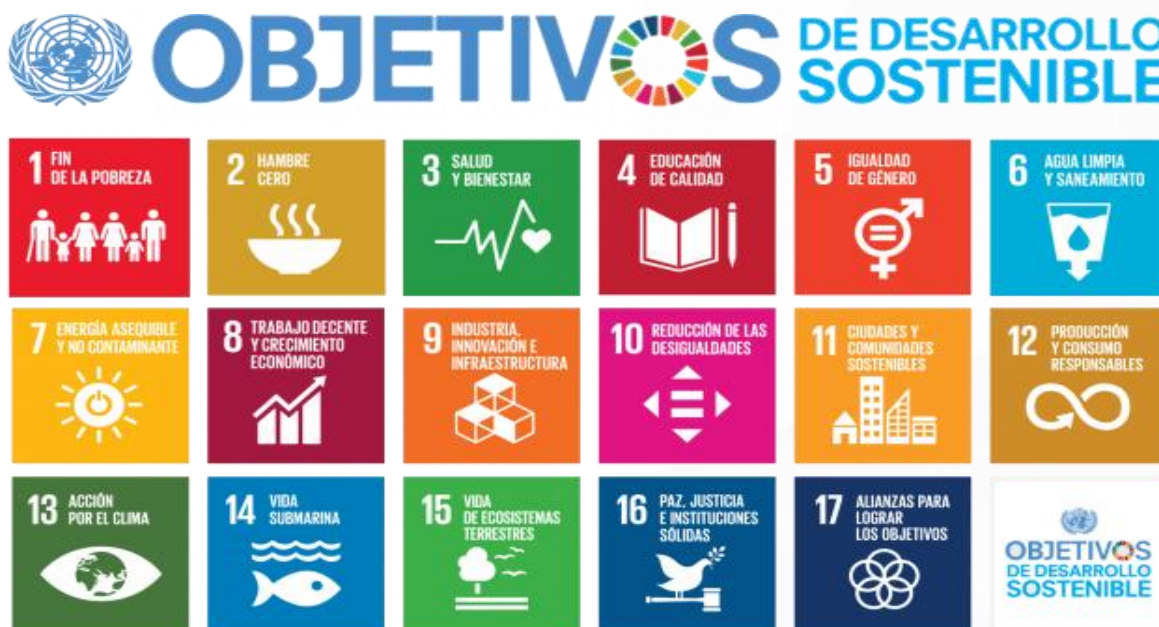
Ilustración 6. Objetivos de Desarrollo Sostenible