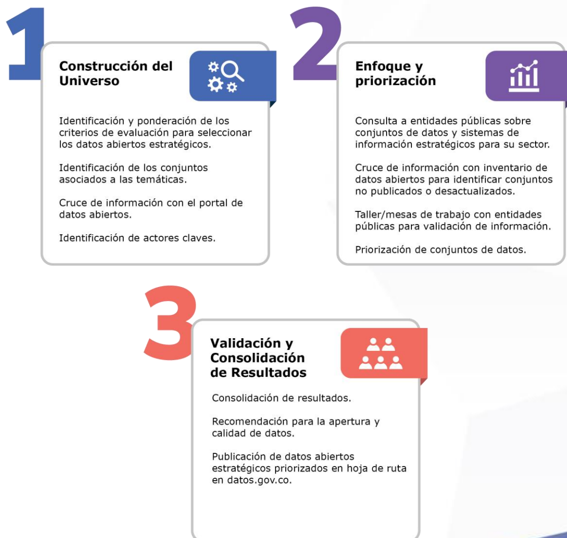
Ilustración 1. Metodología de identificación de datos abiertos estratégicos de la hoja de ruta

Esta metodología contó con las siguientes fases: