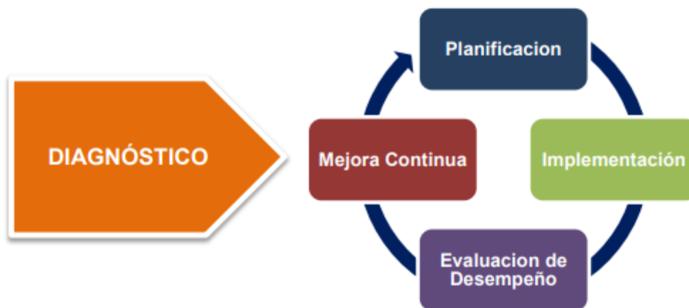
Figura 1 – Ciclo de operación del Modelo de Seguridad y Privacidad de la Información