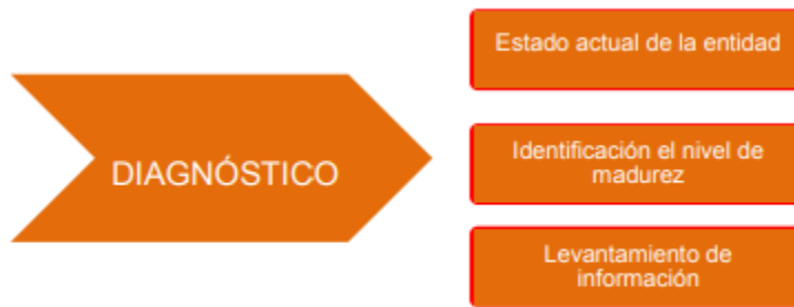
Figura 2 – Etapas previas a la implementación