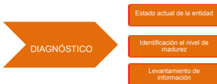
Figura 2 – Etapas previas a la implementación