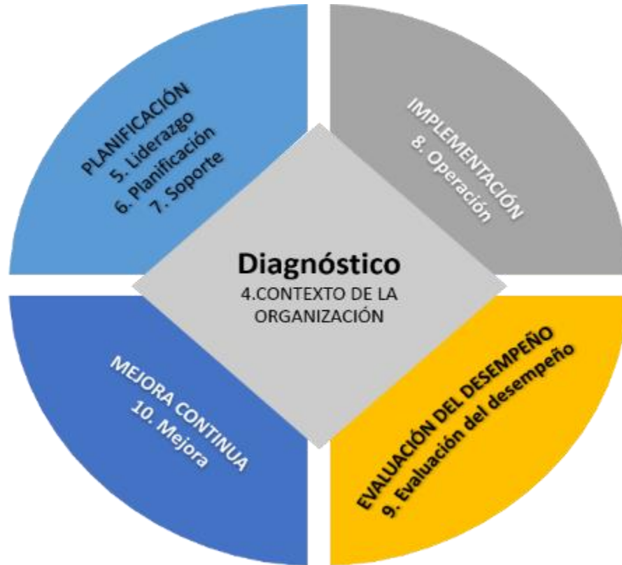
Figura: fuente propia. Alineación de la norma ISO/IEC 27001:2013 frente al ciclo de operación.