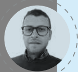
Santiago Spinel Audiovisual