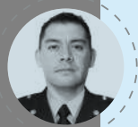
Dg. Harold Caíta Audiovisual