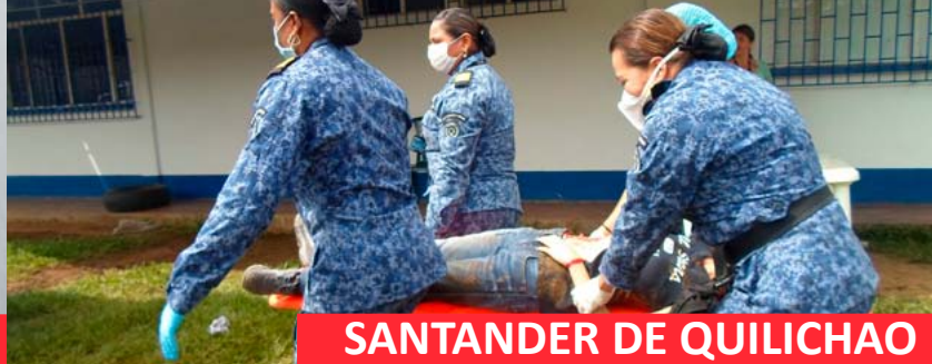
SANTANDER DE QUILICHAO