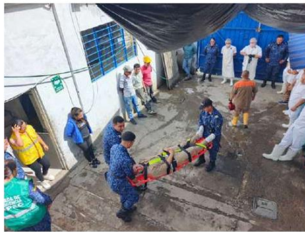
BOLÍVAR - CAUCA