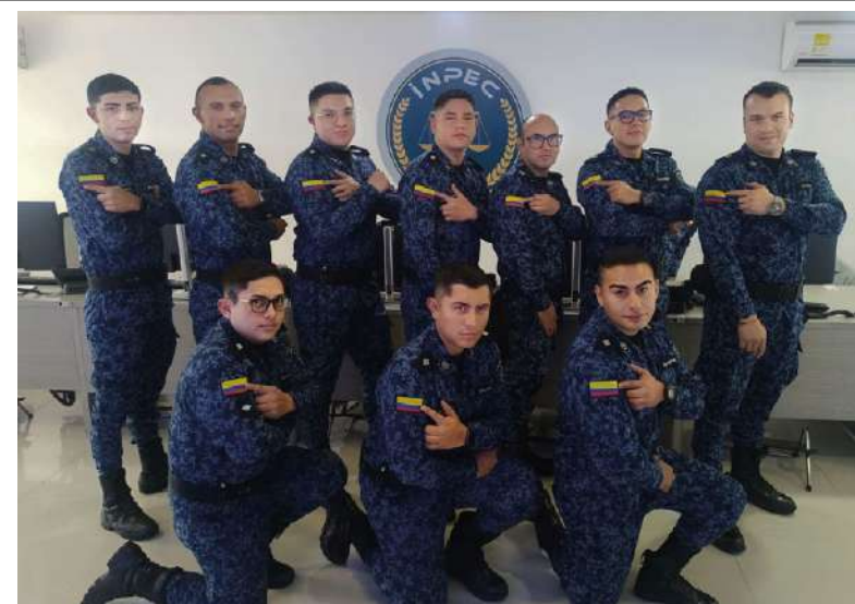
GEDIP - SEDE CENTRAL