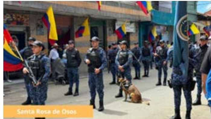
Santa Rosa de Osos