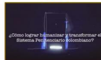
Video institucional sobre Reglas Mandela

Con el fin de conocer en más detalle la información. Se invita a consultar el siguiente link: