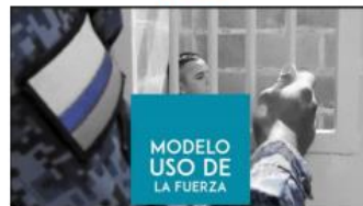
Video sobre Modelo Uso de la Fuerza