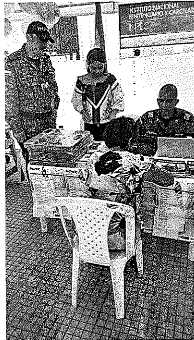
Ferias de Participación al ciudadano DNP - Ipiales (Nariño)