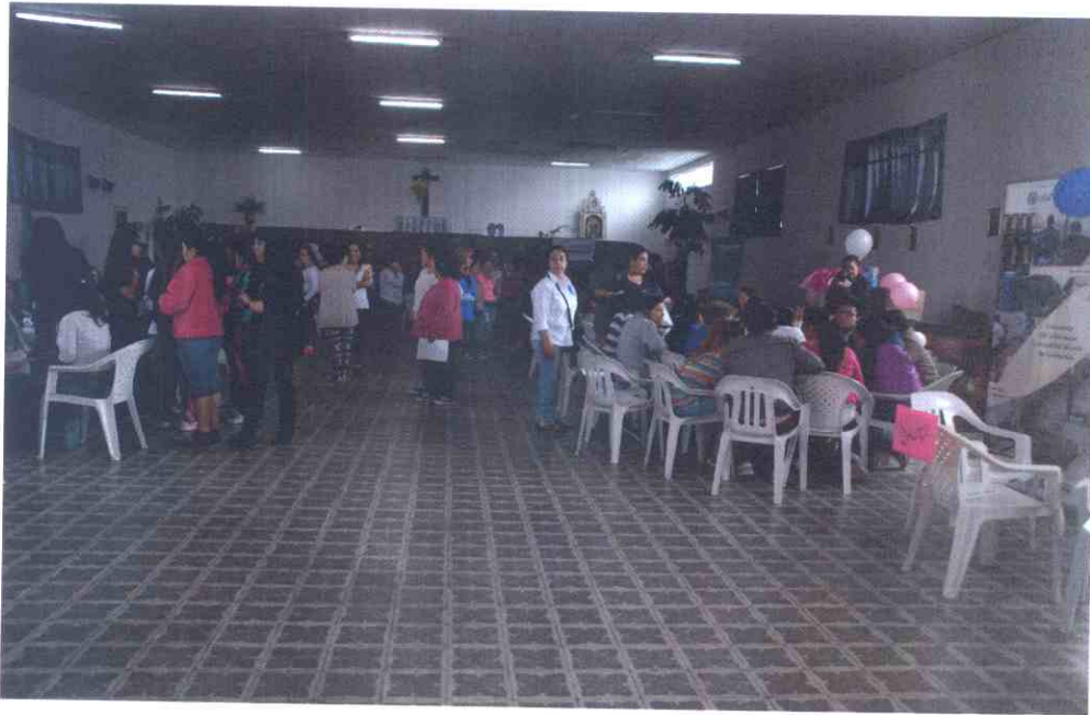
FERIA SECTORIAL EN LA RM DE BOGOTA