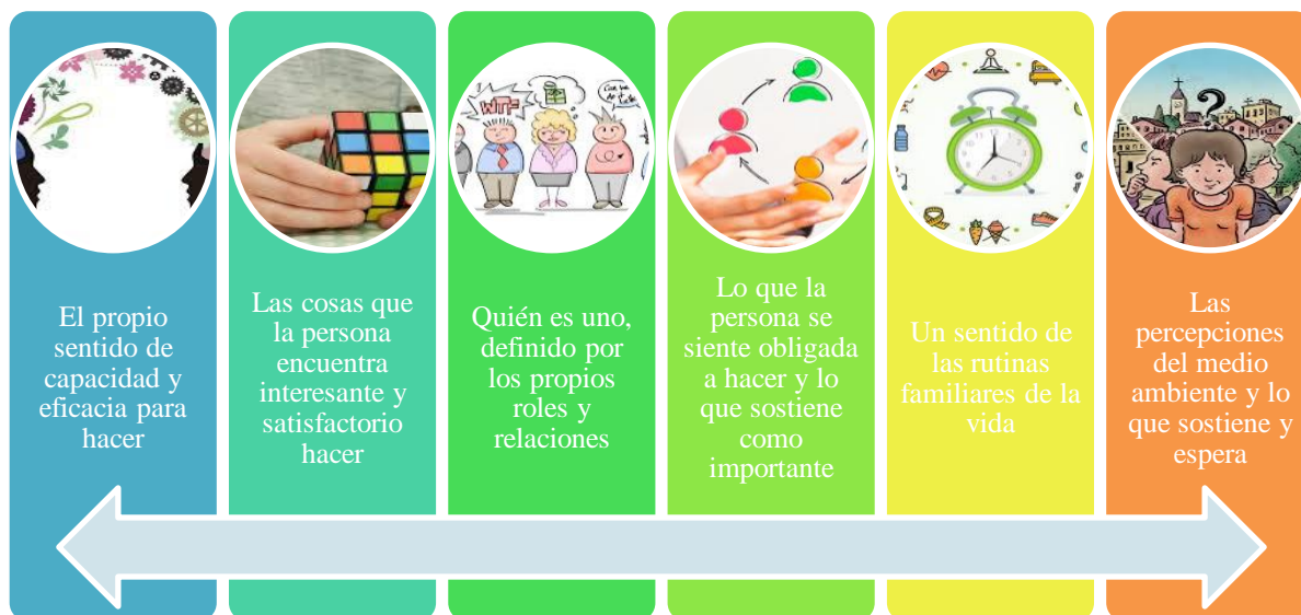
Figura 1. Identidad ocupacional, Tomada de Guzmán (2019. Adaptado de Kielhofner, 2004, p.137).

De este modo, la Identidad Ocupacional hace referencia a “quién es uno y los deseos de convertirse en un ser ocupacional generado a partir de la propia historia de participación ocupacional. La propia volición, habituación y experiencia como cuerpo vivido se integran en la Identidad ocupacional” (Kielhofner, 2004, p. 137) (Figura 1).