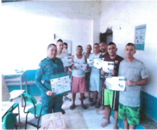
Actividad realizada en Epmc Caucasia