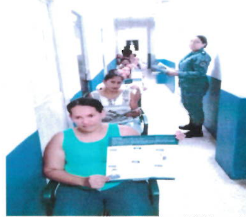
Actividad realizada en CMS Barranquilla