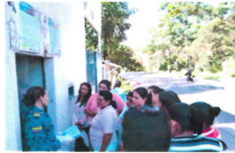
Actividad realizada en Epmsc Moniquira