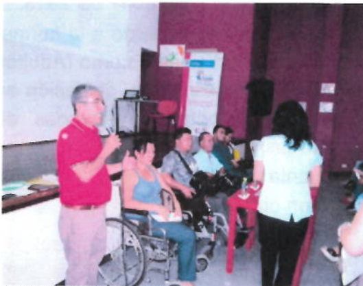
Actividad realizada Epmc San Gil