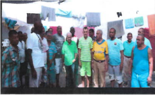
Actividad realizada en Epmsc Santander de Quilichao