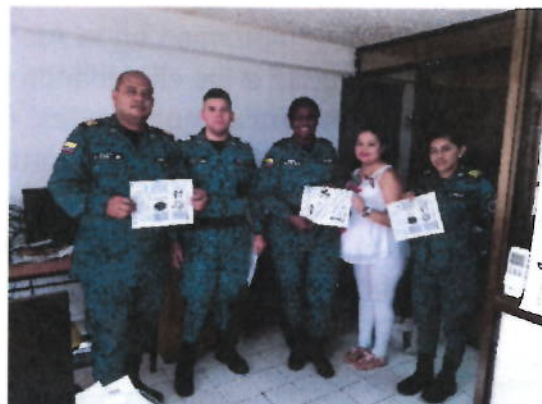
Actividad realizada Epmc Riohacha