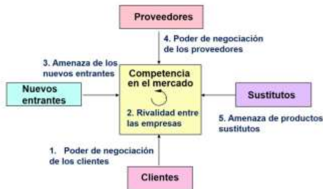
Figura 1. Fuerzas de Porter (Las 5 fuerzas de Porter, s.f.)

En segundo lugar, para poder encontrar una problemática adecuada y analizarla es necesario realizar un análisis del micro-entorno de la organización por lo cual utilizamos la herramienta de las fuerzas de Porter: