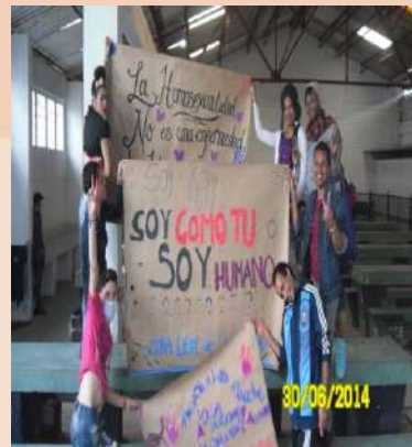
Sensibilización derechos sectores LGBT - EC Bogotá