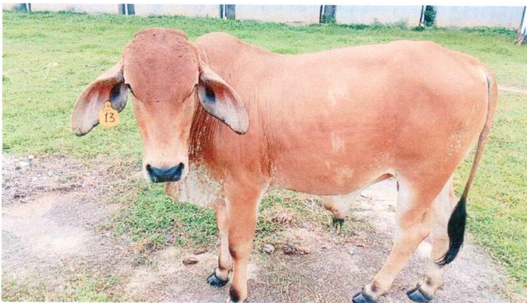
TERNERO F1 GIROLANDO. 160 KILOGRAMOS APROXIMADO