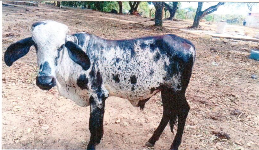
TERNERA F1 DE CEBU. 180 KILOGRAMOS APROXIMADO