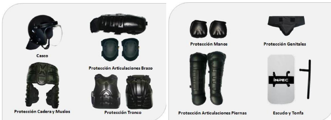
Figura No. 6. Protección antimotines.

4.6 Definición: Destinado al uso en situaciones de control de internos, manejo anti motines y demás labores relacionadas con las actividades propias del servicio.