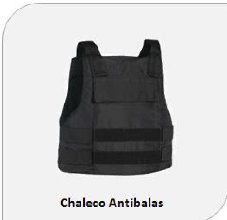
Figura No. 5. Chaleco blindado.

4.4 Definición: Confeccionado en material de fibra, con recubrimiento en icopor. Se usará para actividades propias del servicio como (Control antidisturbios).