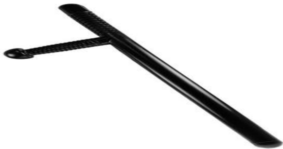
Figura No. 2. Bastón de mando tipo Tonfa (PR24)

4.2 Definición: Elemento contundente que se utiliza para contrarrestar un ataque y como defensa ante agresiones, motines o disturbios, que permite disponer de dos longitudes distintas para realizar movimientos según lo requiera la situación, hecho en diferentes materiales como polipropileno, poliuretano y policarbonato.