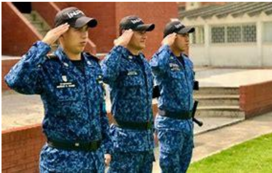
Figura No. 1. Personal del Cuerpo de Custodia y Vigilancia Penitenciaria Nacional.

4.1 Definición: El Cuerpo de Custodia y Vigilancia Penitenciaria y Carcelaria Nacional es un organismo armado, de carácter civil y permanente, que cumple un servicio público esencial, a órdenes del Instituto Nacional Penitenciario y Carcelario Inpec. El Decreto 407 de 1994 regula lo relativo a formación, capacitación, ascensos, etc., de los miembros de este organismo.