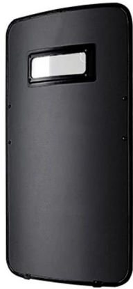
Figura No. 8. Escudo blindado.

4.8 Definición: Utilizado por el CRI y CORES, en los esquemas de seguridad para el ingreso y al interior de los Establecimientos de Reclusión o en las remisiones que se requiera cuando el procedimiento así lo amerite.