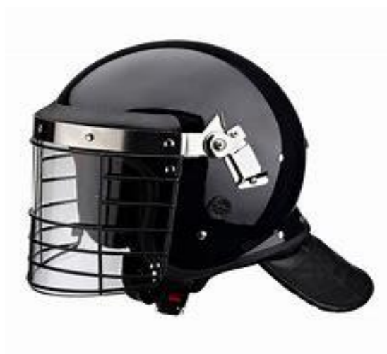
Figura No. 4. Casco de protección antidisturbios.

Será usado para actividades del servicio y ceremonias. Forrado en tela azul oscura y sobre este irá impreso al lado derecho el escudo del INPEC en hilo gris perlado, para los grupos especiales será el escudo de la especialidad.