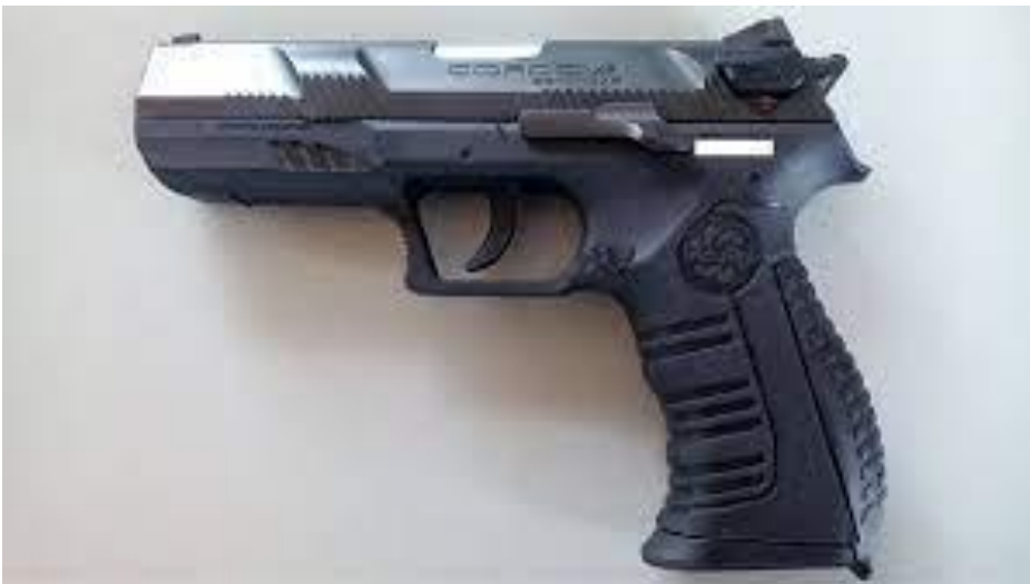
Figura No. 16. Pistola Cordova Calibre 9 mm.

4.15 Definición: Constan de unas restricciones de manos unidas a unas restricciones de pies mediante una cadena; se inicia colocando las restricciones de manos como se indica en el numeral 3.1.1 posteriormente se colocan las restricciones de pies como se indica en el numeral 3.1.2. Se debe tener en cuenta que las restricciones de pies siempre deben estar sujetas por el servidor del Cuerpo de Custodia y Vigilancia para evitar que sean usadas como un arma contundente por parte de la persona privada de la libertad.