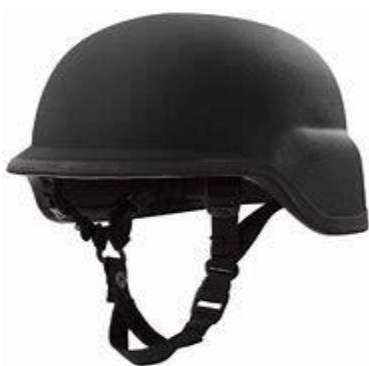
Figura No. 3. Casco blindado.

Esta dispuesto para el uso del CCV como medio de prevención y reacción a lo cual aduce su nombre (PR) y 24 a las pulgadas de su longitud.