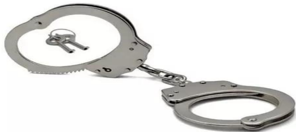
Figura No. 11. Restricciones metálicas para manos.

4.11 Definición: son un dispositivo diseñado para mantener juntas las muñecas de un individuo.