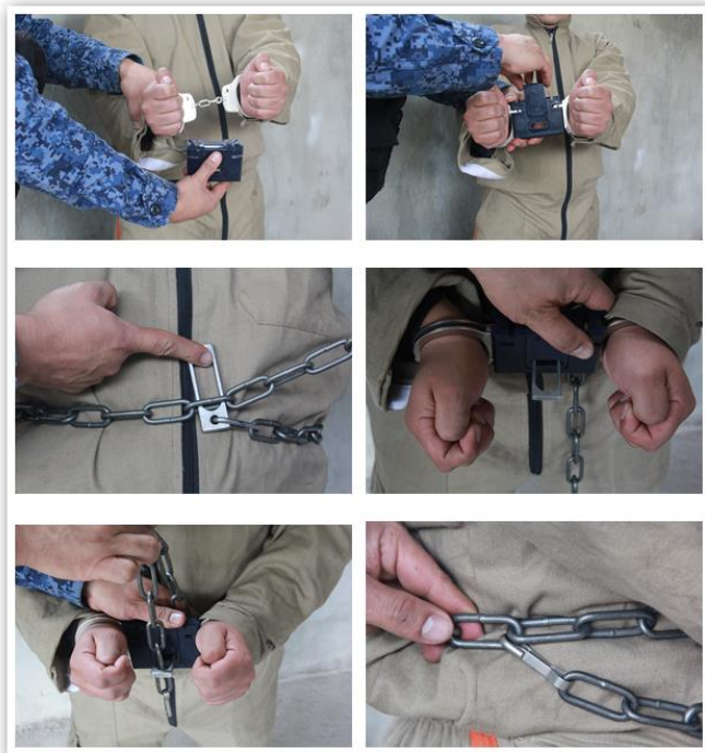
Figura No. 13. Cadena de cintura y caja negra.