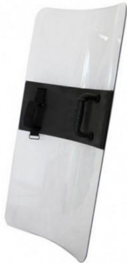
Figura No. 9. Escudo acrílico.

4.8 Definición: Utilizado por el CRI y CORES, en los esquemas de seguridad para el ingreso y al interior de los Establecimientos de Reclusión o en las remisiones que se requiera cuando el procedimiento así lo amerite.