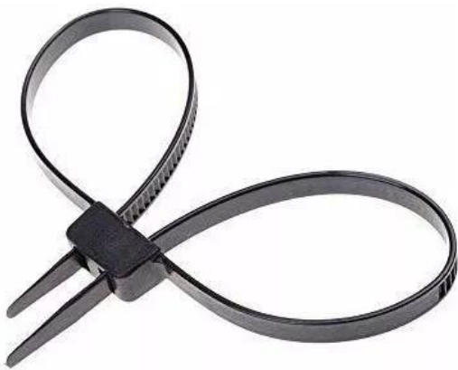
Figura No. 14. Restricciones plásticas.

La cadena de cintura se utiliza como complemento al uso de la caja negra, con el fin de limitar la movilidad de la persona privada de la libertad; el servidor del CCV se ubica a un costado de la persona privada de la libertad rodeando la cintura del mismo con la cadena y cruzando la hebilla por uno de sus eslabones; para tener un ajuste adecuado a la cintura, se pasa la hebilla por el orificio rectangular de la caja negra y el excedente de la cadena se debe pasar por la parte superior atravesando la hebilla; el sobrante de la cadena se asegura al costado de la cintura de la persona privada de la libertad, con el dispositivo dispuesto en la cadena.