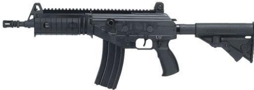
Figura No. 10. Fusil Galil ACE 21.

4.9 Definición: Elaborado en material transparente de alto impacto y será utilizado en procedimientos de seguridad que impliquen el uso de la fuerza.