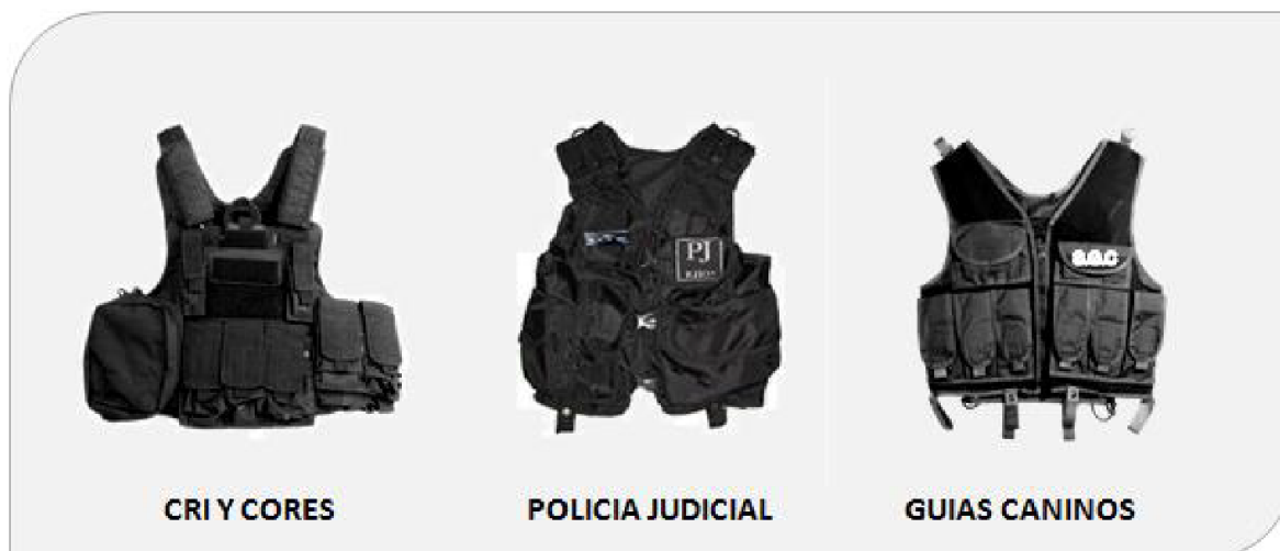
Figura No. 7. Chaleco táctico multiusos.

4.6 Definición: Destinado al uso en situaciones de control de internos, manejo anti motines y demás labores relacionadas con las actividades propias del servicio.