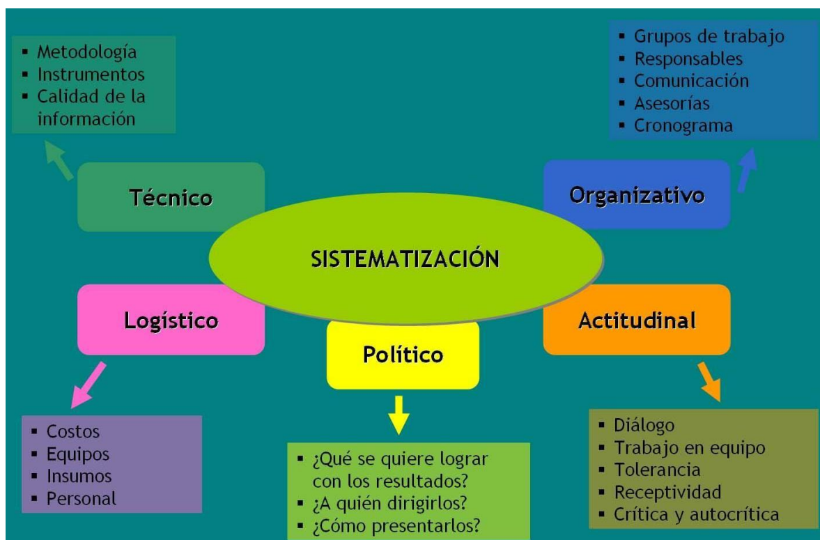
Ilustración 6. Componentes del proceso de sistematización

Para que la sistematización de experiencias sea útil y funcional, debe contar con ciertas características esenciales (Jara, 2011):