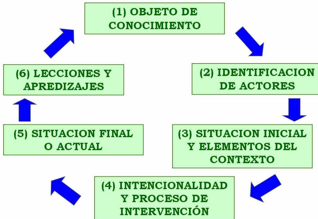
Ilustración 5. Momentos de sistematización

La experiencia es un proceso individual o colectivo de carácter social que ocurre en un determinado momento, bajo un cierto contexto y con algunas causas en específico que se presentan bajo unas circunstancias concretas, dichos procesos juegan un papel fundamental pues permite la obtención de información que emplea la persona o el grupo para evolucionar en sus actividades y mejorar sus procedimientos, combinando dimensiones objetivas y subjetivas según sea la situación (Jara, 2020).