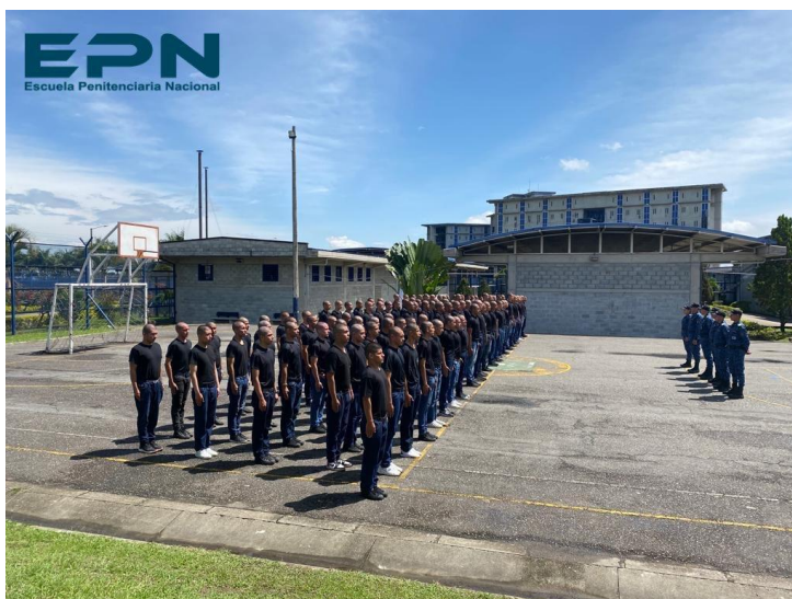
Ilustración 4. Escuela del INPEC