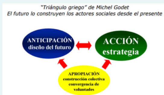
Figura 14 "Triángulo griego" de Michel Godet. Ha sido transformado desde el Triángulo Griego de Isaac Newton.