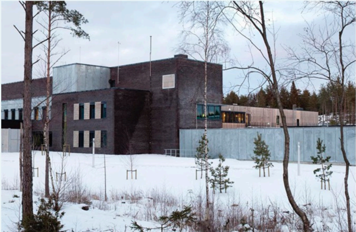
FIGURA 7 Prisión de Bastøy, Handel Fengsel. Noruega.