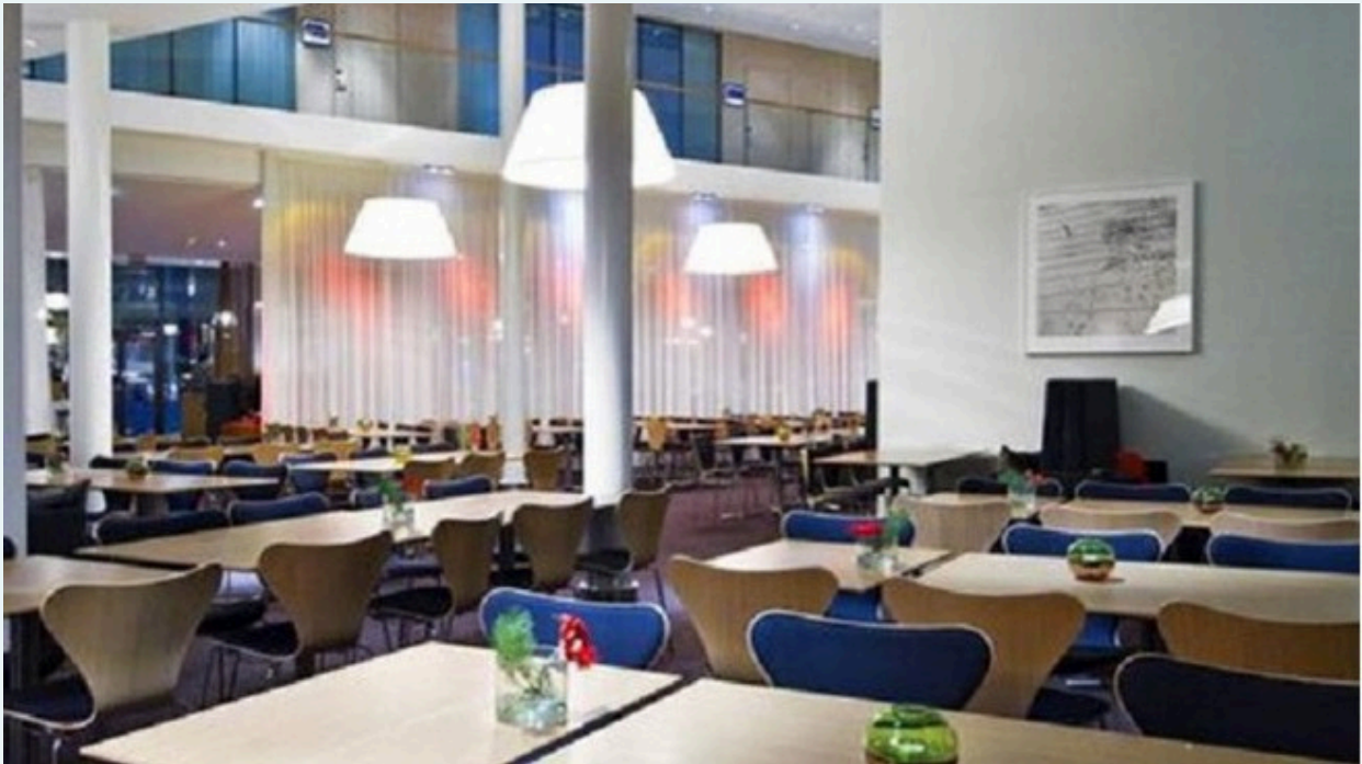
Zonas comedoras de la Prisión de Sollentuna, Estocolmo. Suecia.