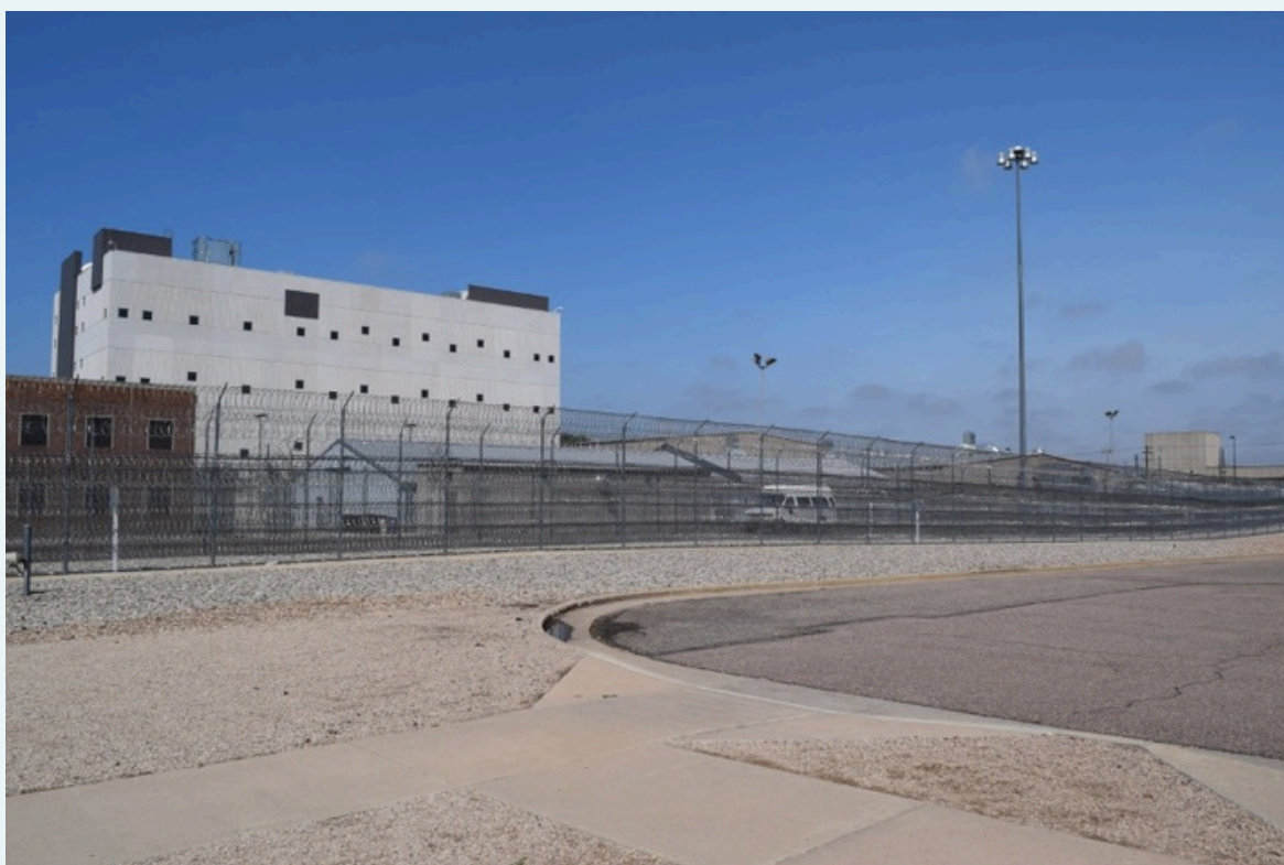
FIGURA 4 Exterior del Denver Complex, Colorado. EEUU