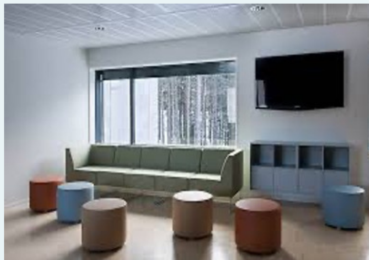
FIGURA 8 Celdas, Sala y Comedores. Prisión de Bastøy, Handel Fengsel. Noruega.