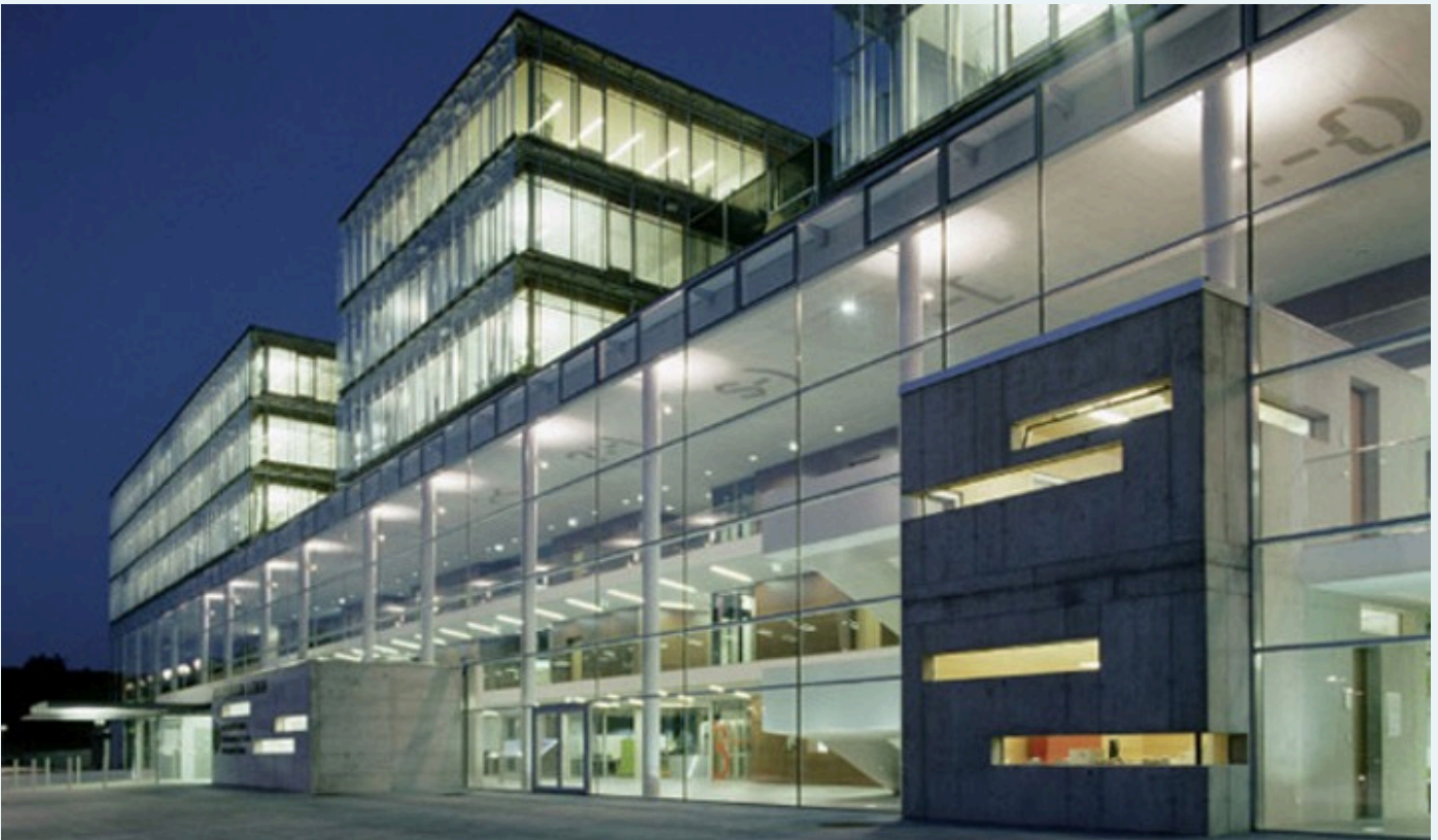
FIGURA 9 Instalaciones Justice Center of Leoben, Leoben. Austria.

habitaciones separadas con baño y cocina privados, ventanales irrompibles, escritorios y estanterías. Dotado de un completo gimnasio, dispone de habitaciones para conyugales y lugares para recibir las visitas.