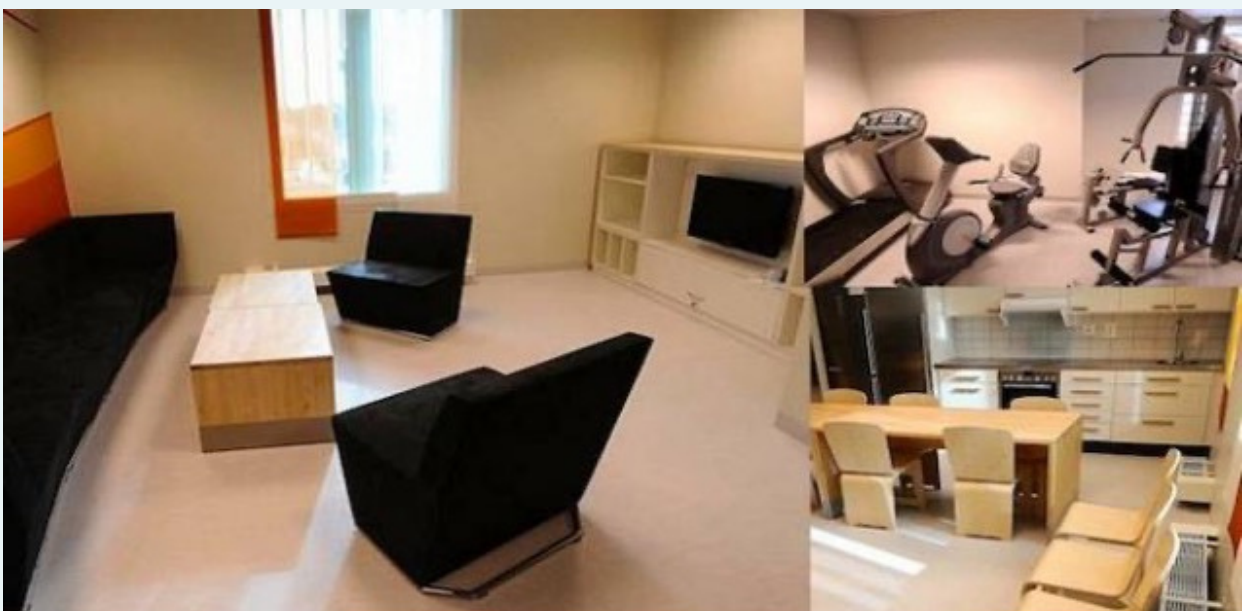
Mobiliarios de celdas de la Prisión de Sollentuna, Estocolmo. Suecia.