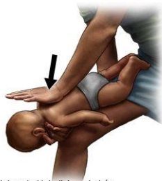
Maniobra de Heimlich en bebés (golpes en la espalda)

Sostenga al niño con la cara hacia abajo y con la cabeza un poco más abajo de sus pies. Apoye la mandíbula y cabeza del bebé con su mano. Sujete el peso del bebé con su rodilla si usted está sentado. Utilice el antebrazo si está de pie.