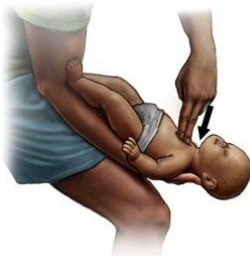
Maniobra de Heimlich en bebés (empujes de pecho)

Coloque al bebé entre sus brazos y manos y gírelo sobre su espalda. Apoye la cabeza y cuello con su mano. La cabeza del bebé debería estar poco más abajo que los pies.