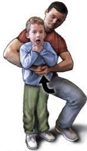
Maniobra de Heimlich para niños

Use menos fuerza en un niño que lo que usaría en un adulto