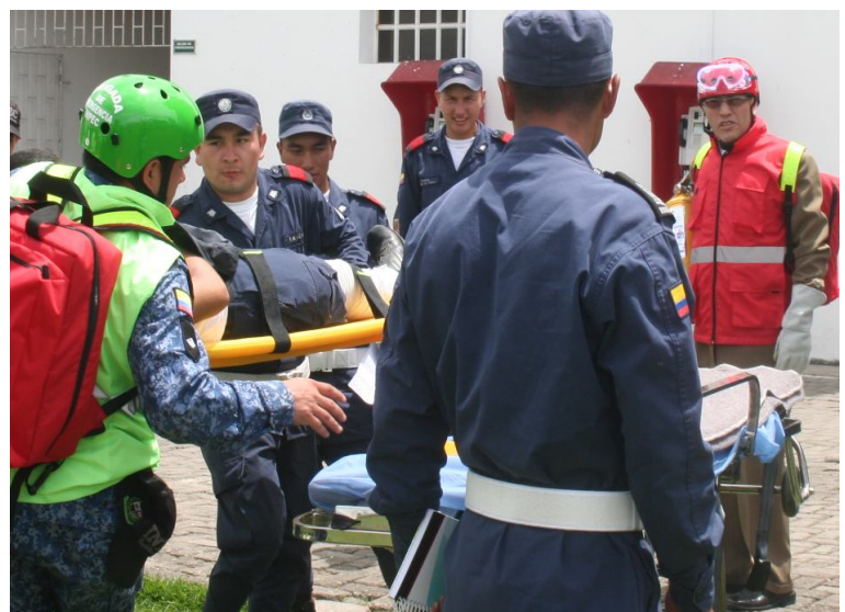
Brigadas de salud y auxiliares bachilleres colaborando en el simulacro de evacuación y atendiendo a heridos producido por los efectos del fenómeno.