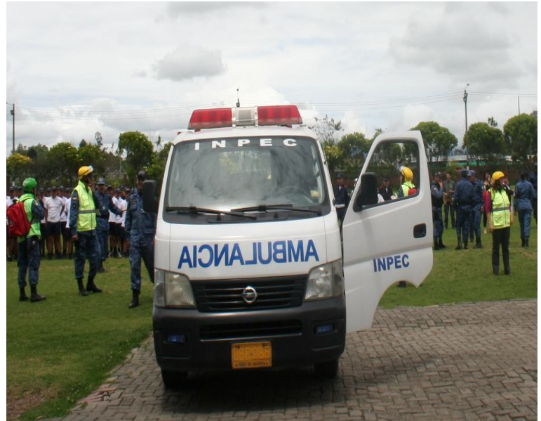
El grupo de transporte y ambulancia, presta sus servicios de emergencia de traslado de heridos a los diferentes centros de salud del municipio de Funza Cundinamarca.