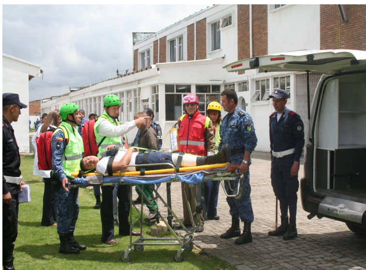
Brigadistas y funcionarios del Cuerpo de Custodia y Vigilancia apoyan con Transporte de emergencia a heridos, a los centros de salud cercana