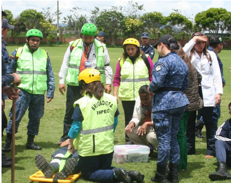
Brigada de salud, atentos y prestando los primeros auxilios a un personal herido en simulacro presentado el día martes 17 de octubre en la Escuela de Formación.