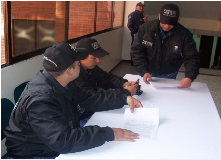
Dragoneantes del Cuerpo de Custodia y Vigilancia de policía judicial listos a prestar su servicio en la UNAD. Bogotá.

PRESENTACIÓN A LA PRUEBA FINAL PARA LOS CURSOS DE ASCENSO DEL CUERPO DE CUSTODIA Y VIGILANCIA EN LA UNIVERSIDAD NACIONAL ABIERTA Y A DISTANCIA EN BOGOTÁ..