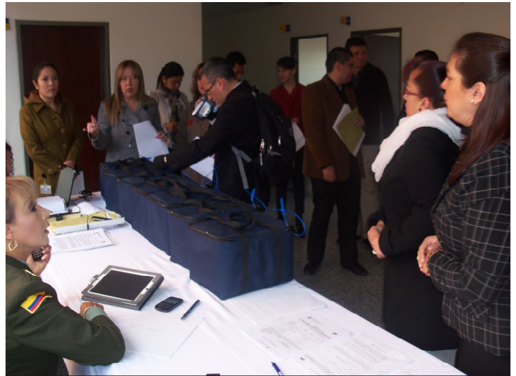
Coordinadores, Funcionarios de la Escuela de Formación y docentes de la UNAD dispuestos a dar inicio y acompañamiento al proceso de las pruebas .