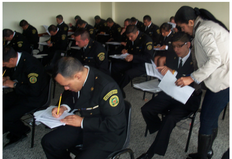
Aclaración dada por la coordinadora de aula y la presentación de la prueba de los demás estudiantes de la Guardia Nacional.