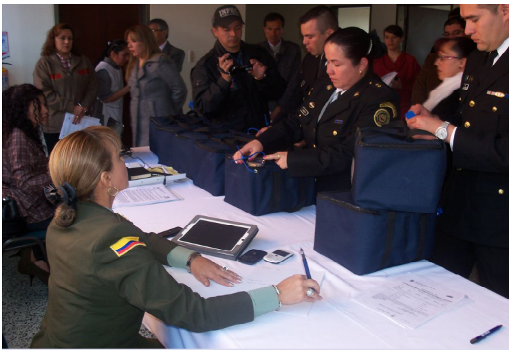
Bajo los principios de transparencia, igualdad, oportunidad, veracidad y cumplimiento funcionarios del Cuerpo de Custodia y Vigilancia, supervisan las tulas que contienen las pruebas a presentar.